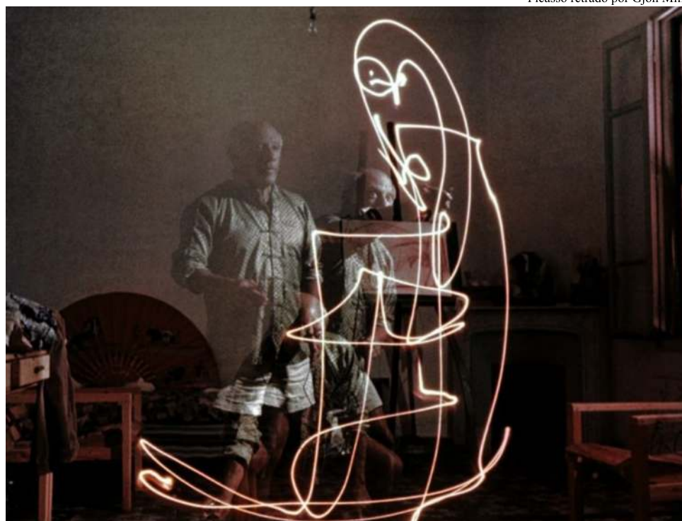
Picasso retrado por Gjon Milli

La técnica se trata de grabar el recorrido de la luz configurando la cámara para una larga exposición y la apertura de la cámara y velocidad de disparo, con esto logramos retratar en una foto un dibujo completo. Los chicos fueron pasando uno por uno, saliéndose de la hoja ahora tenían muchísimo espacio para dibujar utilizando el cuerpo, estirando los brazos, girando, haciendo pasos de un lado hacia el otro, elegimos como tema la vegetación, y así fue como aparecieron arboles, flores, hojas y otras figuras sorpresa que vimos una vez que imprimimos las fotos. ♦